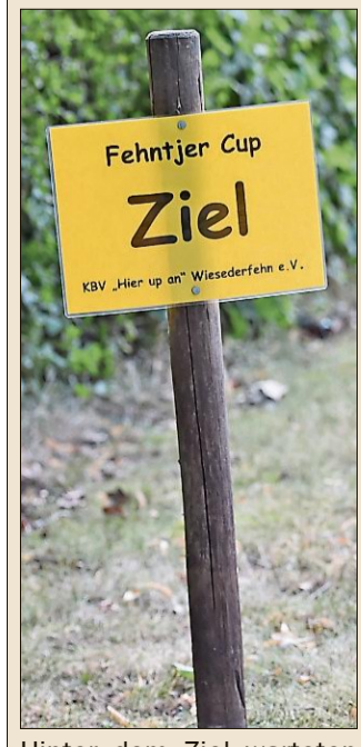
Hinter dem Ziel warteten Erfrischungen.