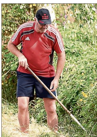
Auf der Suche nach der Kugel im Schloot.