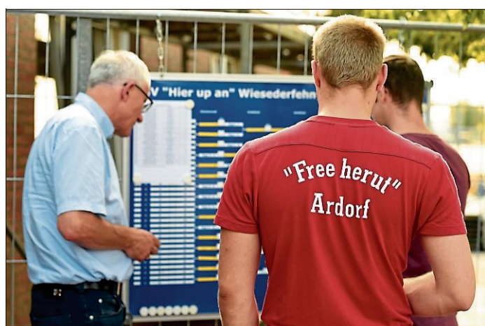
Nachdem die ersten Ergebnisse aushingen, wollte jeder wissen, gegen wen es in die K.o.-Runde geht.