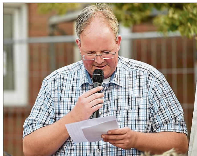
Alles wurde still als verkündet wurde, wer in der K.o.-Runde gegeneinander antritt.