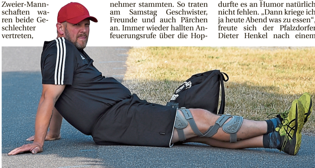
Bei hohen Temperaturen und strahlendem Sonnenschein waren schattige Plätze auf der Strecke sehr willkommen.